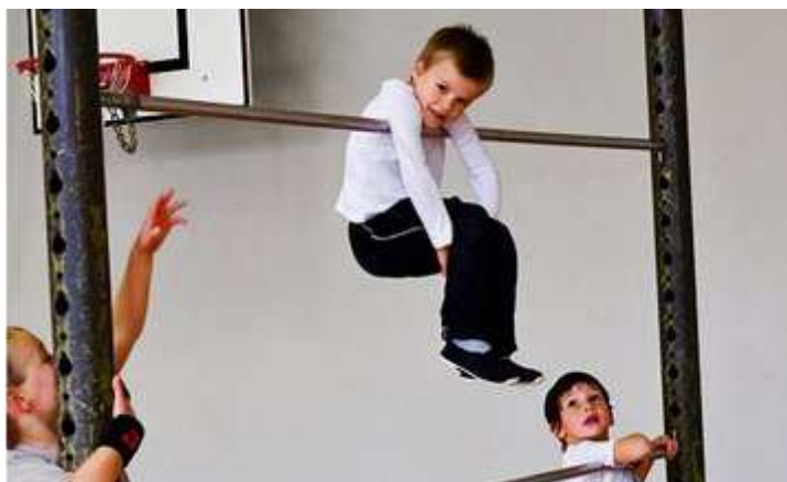
Lesen und Rechnen in der Turnhalle: In Magglingen genießt eine Modellklasse «bewegten Unterricht».

Umgekehrt gilt: je höher das Bildungsniveau der Eltern, desto grösser das sportliche Engagement der Kinder. Das kann verschiedene Gründe haben. Eltern geben ihr Bewegungsverhalten an Kinder weiter, und viele Sportkurse kosten Geld.