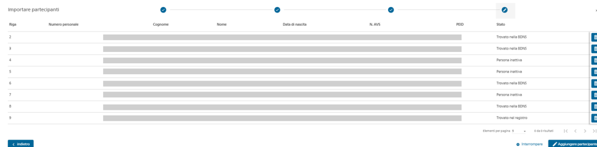
Figura 5: panoramica finale

Dopo il confronto del registro è visualizzata una panoramica finale di tutte le persone: