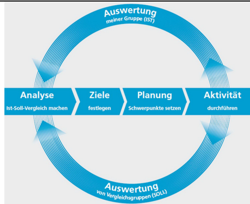
PIS s. 7ff