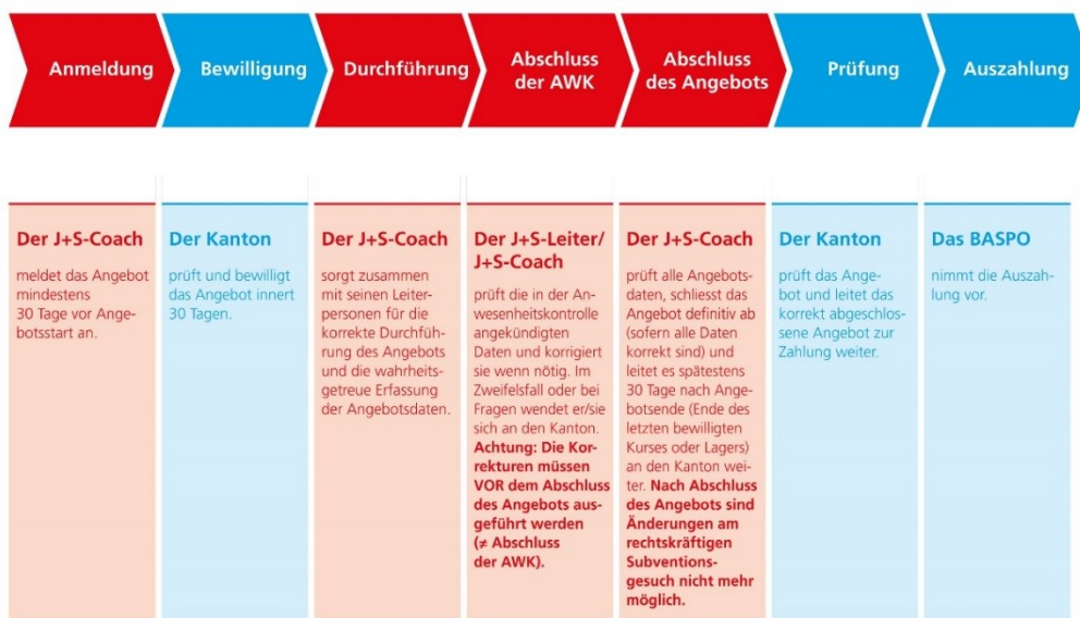
Abb. 1: Prozess J+S-Angebote

Die Bewilligung und die Prüfung von Angeboten der Kantone und der nationalen Sportverbände in der NG4 erfolgt durch das BASPO.