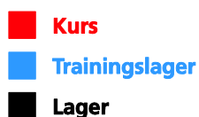
Abb. 1: Beispiel J+S-Angebot