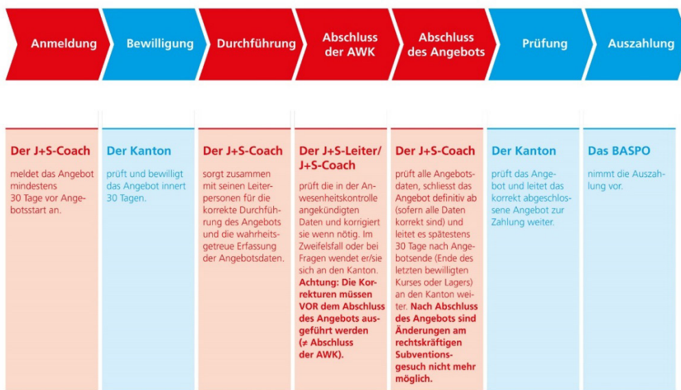
Abb. 1: Prozess J+S-Angebote

Die Bewilligung und die Prüfung von Angeboten der Kantone und der nationalen Sportverbände in der NG4 erfolgt durch das BASPO.