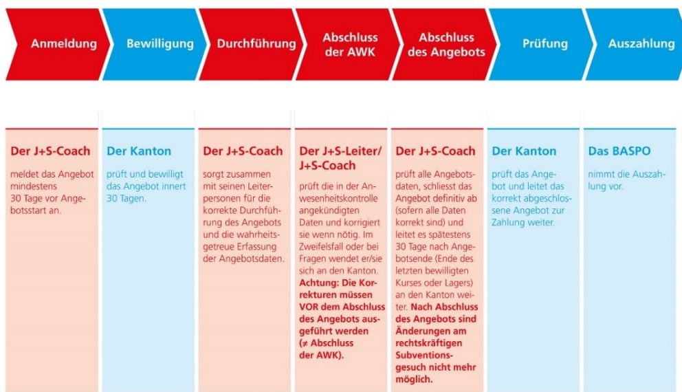
Abb. 1: Prozess J+S-Angebote

Die Bewilligung und die Prüfung von Angeboten der Kantone und der nationalen Sportverbände in der NG4 erfolgt durch das BASPO.