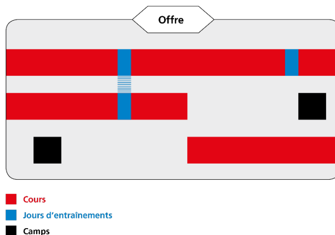
Fig. 1: Exemple d'offre J+S

Les cours (y compris les journées d'entraînements) et les camps annoncés ensemble par un organisateur à l'autorité compétente pour une durée maximale d'une année sont réunis sous l'appellation d'offre.