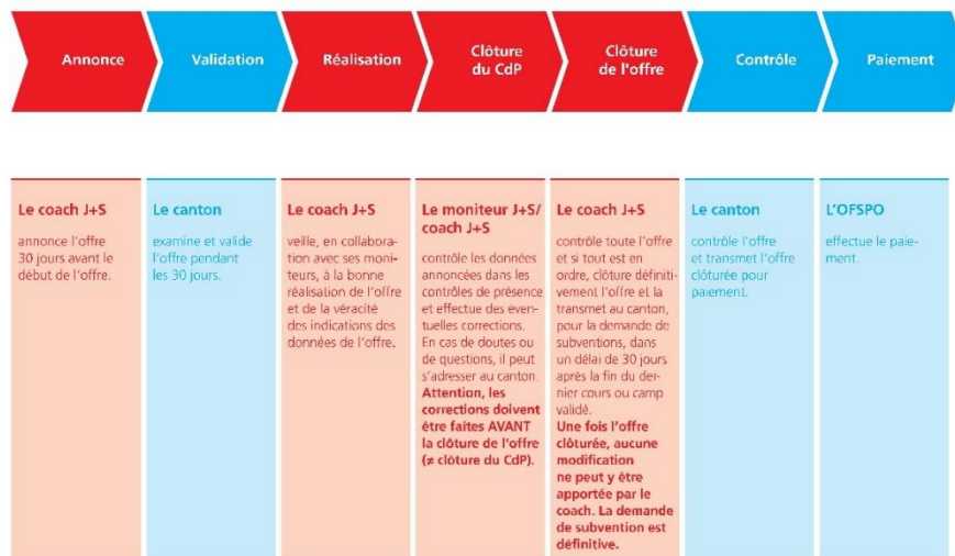
Fig. 1: Procédure d'une offre J+S

La validation et le contrôle des offres du GU 4 des cantons et des fédérations sportives nationales se font par l'OFSP.