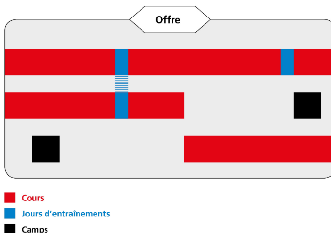
Fig. 1: Exemple d'offre J+S

Les cours (y compris les journées d'entraînements) et les camps J+S annoncés ensemble par un organisateur à l'autorité compétente pour une durée maximale d'une année sont réunis sous l'appellation d'offre.