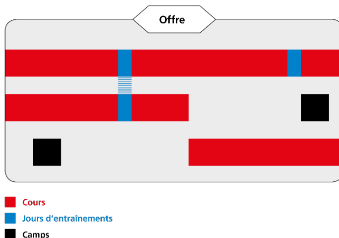
Fig. 1: Exemple d'offre J+S

Les cours (y compris les journées d'entraînements) et les camps J+S annoncés ensemble par un organisateur à l'autorité compétente pour une durée maximale d'une année sont réunis sous l'appellation d'offre.