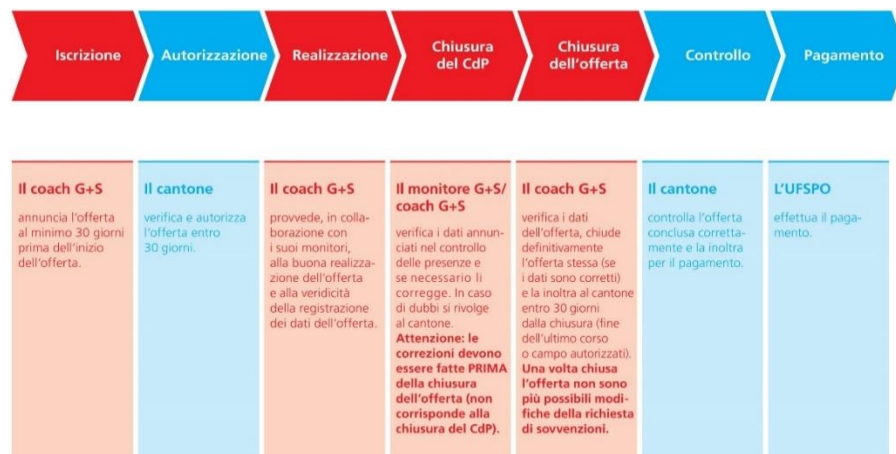
Fig. 1: processo delle offerte G+S

L'autorizzazione e il controllo delle offerte del GU 4 dei Cantoni e delle federazioni sportive nazionali sono eseguite dall'UFSPO.