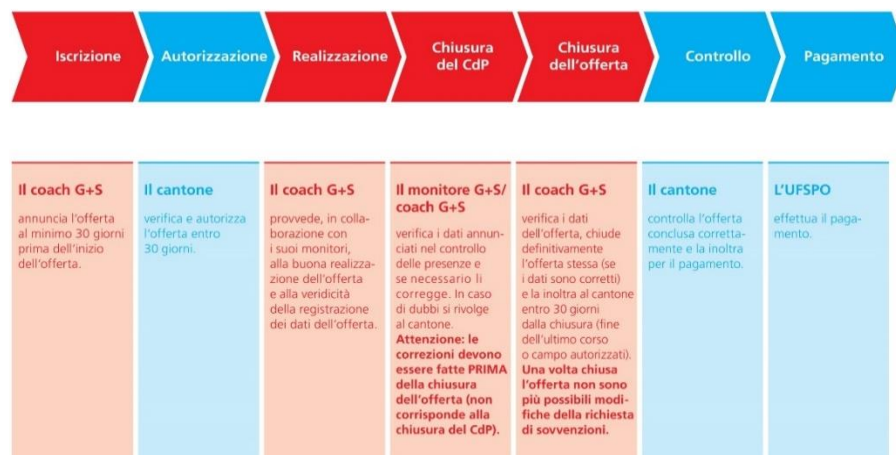
Fig. 1: processo delle offerte G+S

L'autorizzazione e il controllo delle offerte del GU 4 dei Cantoni e delle federazioni sportive nazionali sono eseguite dall'UFSPO.