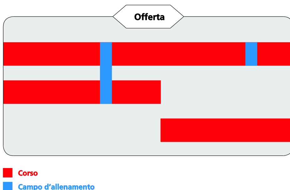
Fig. 1: esempio di un'offerta G+S

I corsi e i campi G+S previsti sull'arco di un anno al massimo, che l'organizzatore annuncia tutti insieme all'autorità competente per l'autorizzazione, vengono riuniti sotto la stessa offerta G+S.