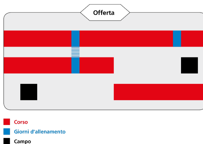
Fig. 1: esempio di un'offerta

I corsi (incl. giorni di allenamento) e i campi previsti sull'arco di un anno al massimo, che l'organizzatore annuncia tutti insieme all'autorità competente per l'autorizzazione, vengono riuniti sotto la stessa offerta.