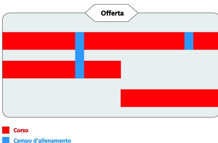
Fig. 1: esempio di un'offerta G+S

I corsi e i campi G+S previsti sull'arco di un anno al massimo, che l'organizzatore annuncia tutti insieme all'autorità competente per l'autorizzazione, vengono riuniti sotto la stessa offerta G+S.