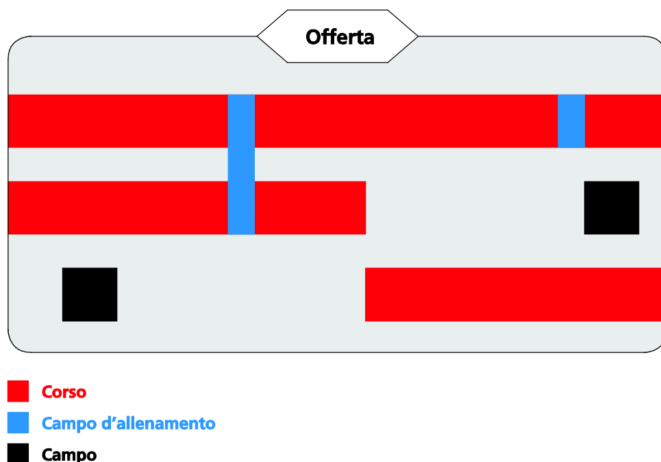
Fig. 1: esempio di un'offerta G+S

Gli organizzatori offrono corsi o campi in una o più discipline sportive G+S.