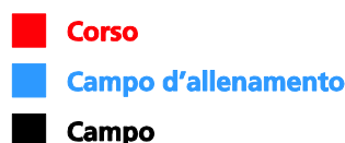
Fig. 1: esempio di un'offerta G+S