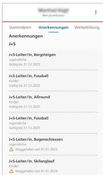
Abbildung: Anerkennungen einsehen