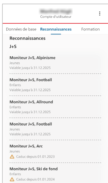
Illustration : Consulter les reconnaissances