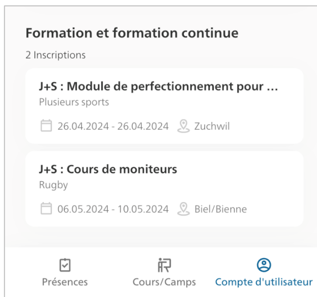
Illustration : Affichage des formations en cours/à venir