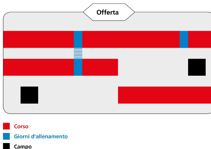
Fig. 1: esempio di un'offerta

I corsi (incl. giorni di allenamento) e i campi previsti sull'arco di un anno al massimo, che l'organizzatore annuncia tutti insieme all'autorità competente per l'autorizzazione, vengono riuniti sotto la stessa offerta.